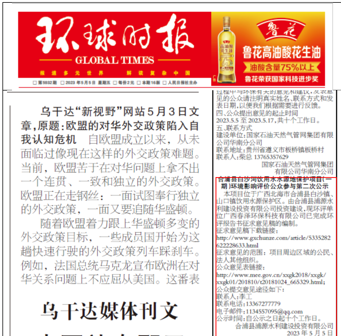
图 3.2-3 项目第二次报纸公示照片