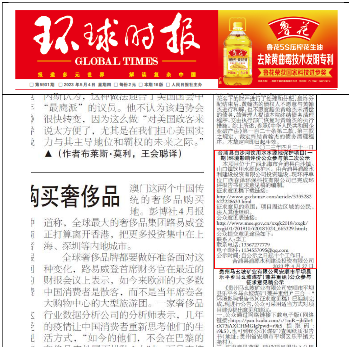
图 3.2-2 项目第一次报纸公示照片