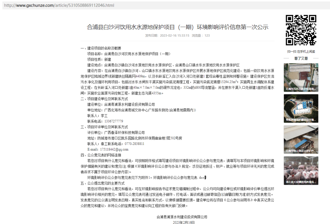
图 2.2-1 本项目首次环境影响评价信息公示截图

公示链接如下： http://www.gxchunze.com/article/5310508869112046.html 公示截图见图 2.2-1。