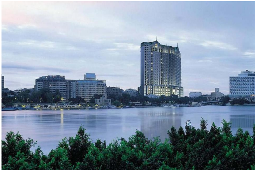
标志性建筑——开罗四季酒店

【首都】埃及首都开罗位于尼罗河三角洲顶点以南14公里处，北距地中海200公里，是埃及的政治、经济、商业和文化中心。开罗省、吉萨省、盖勒尤比省共同组成的大开罗区，人口超过2500万，是阿拉伯和非洲国家人口最多的城市，是世界第十六大都会区。古埃及人称开罗为“城市之母”，阿拉伯人把开罗称作“卡海勒”，意为征服者或胜利者。