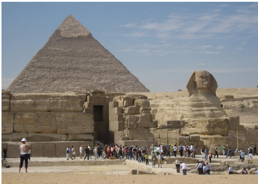
金字塔和狮身人面像

1922年2月28日，英国宣布埃及为独立国家，但保留对其国防、外交、少数民族等问题的处置权。1952年7月23日，以纳赛尔为首的自由军官组织推翻法鲁克王朝，成立革命指导委员会，掌握国家政权。1953年6月18日，宣布成立埃及共和国。