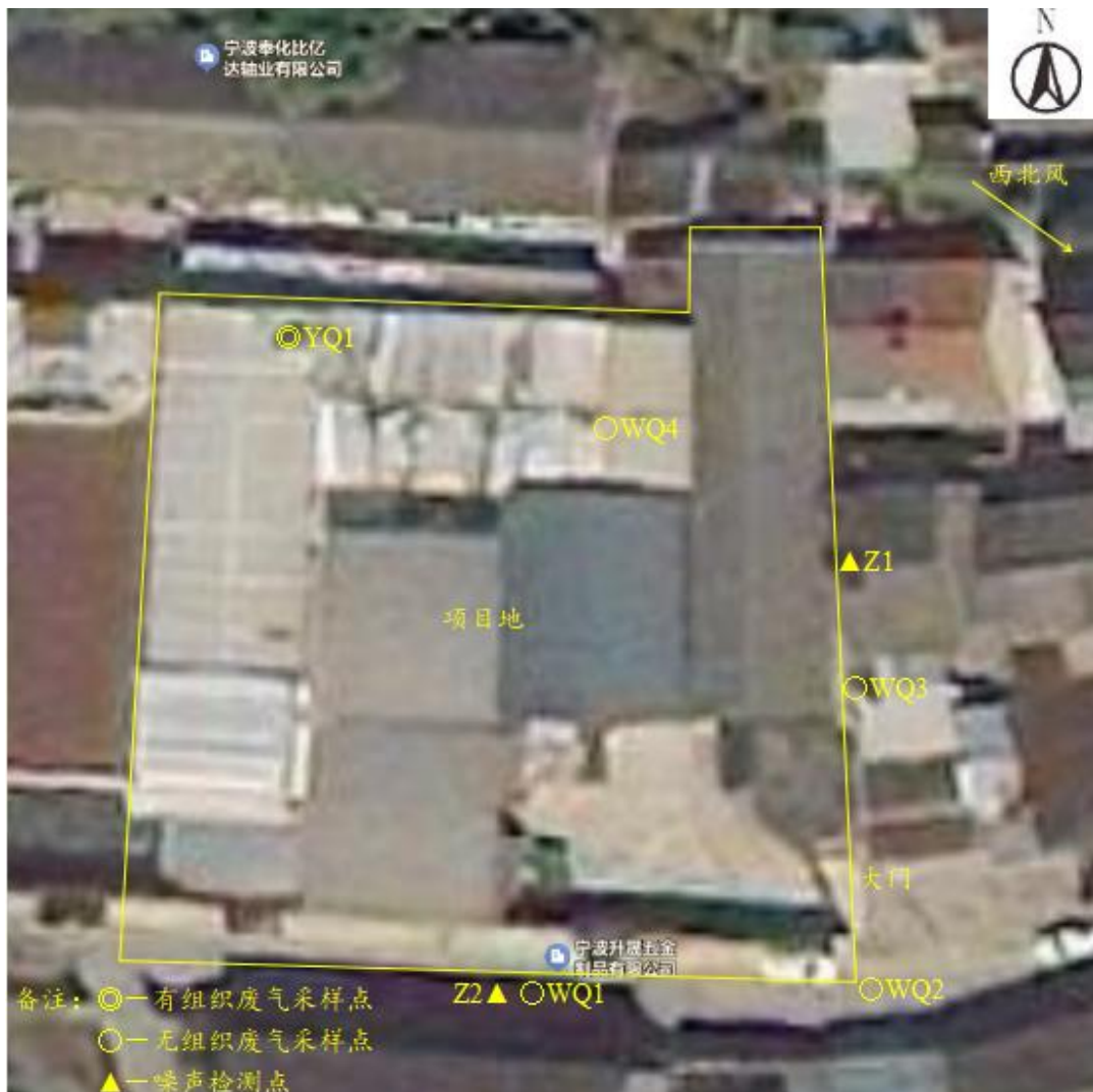
图 6-1 监测点位示意图