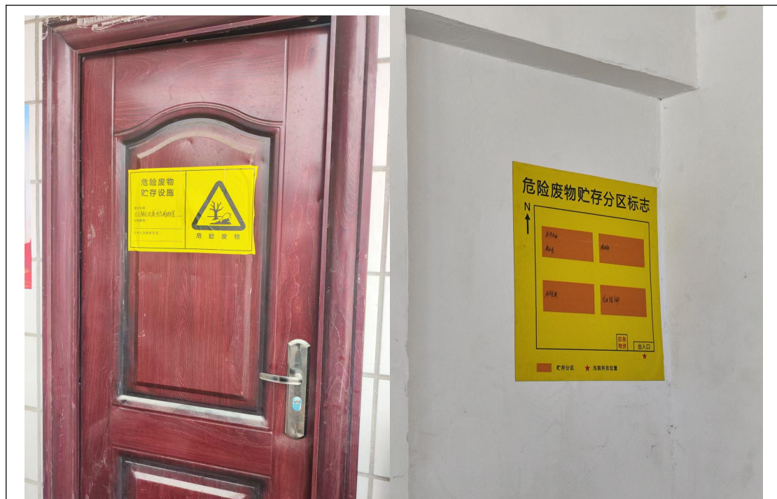
危险废物暂存场所