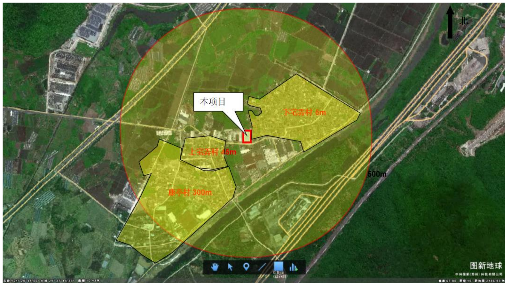
图 2 项目周边环境示意图