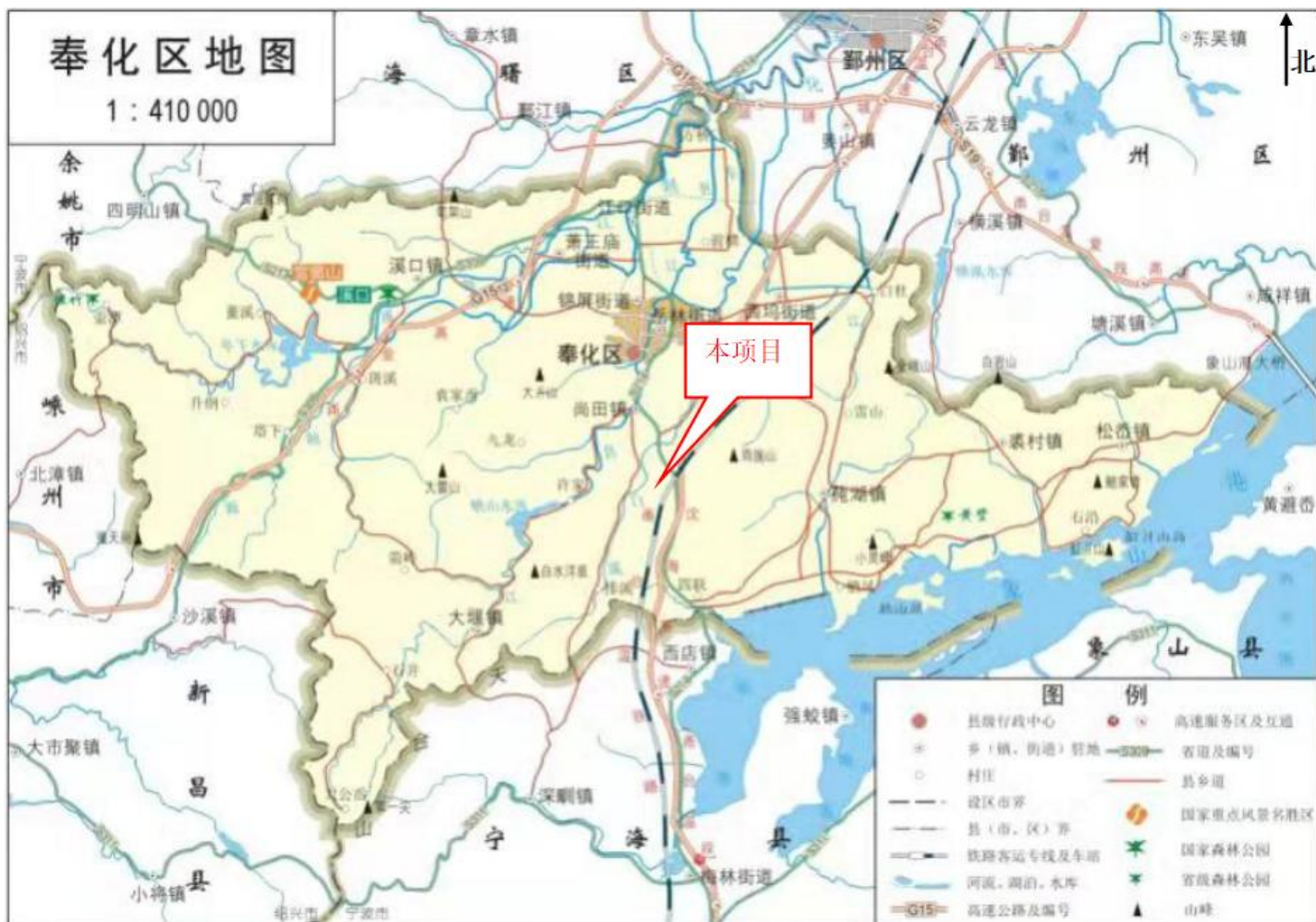
图 1 项目地理位置图