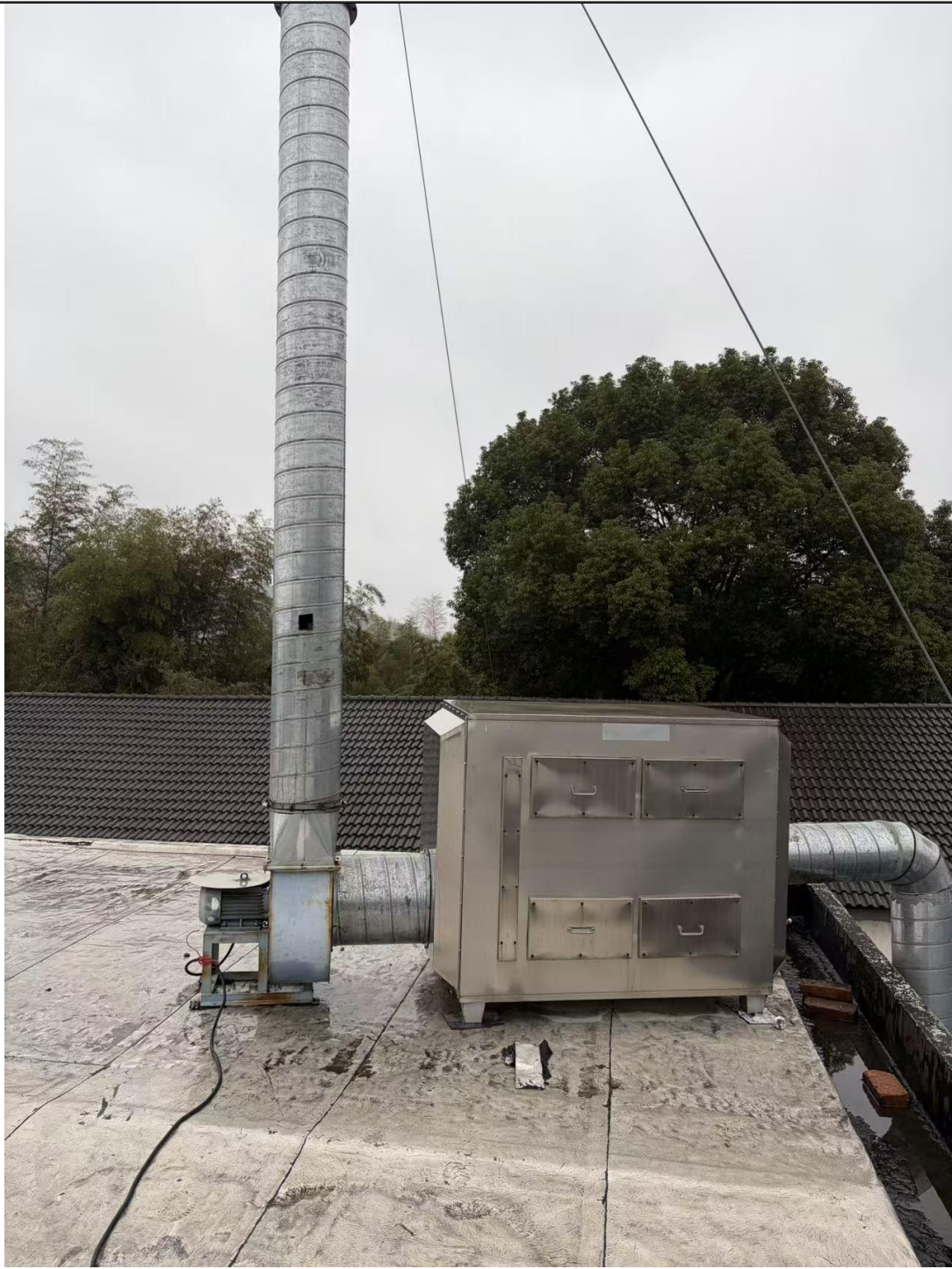
活性炭吸附+15m 高排气筒