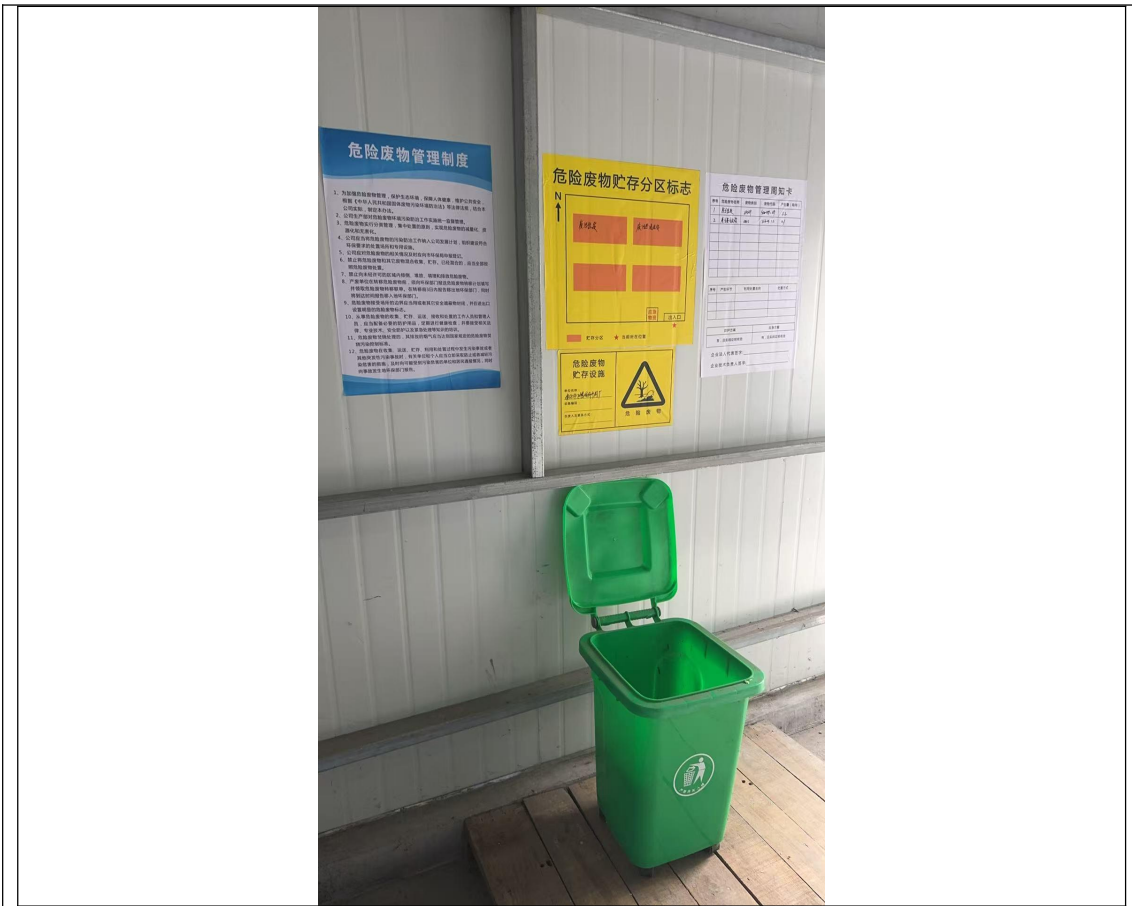
危险废物暂存场所