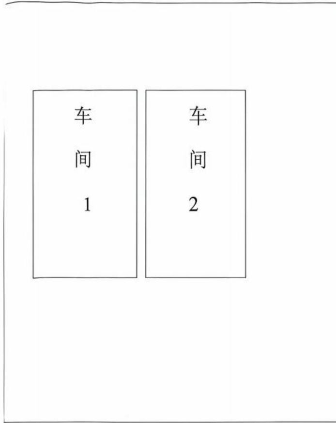
图 2 项目平面示意图