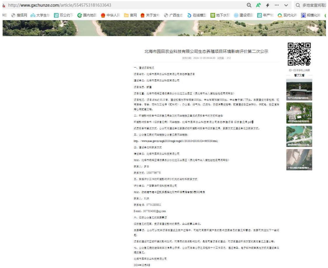
图 3.2-1 征求意见稿网上公示截图