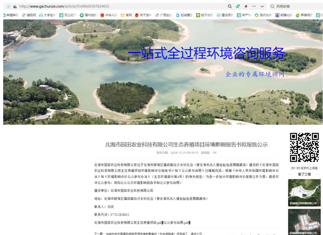
图 6.2-1 项目报批前公开网络截图