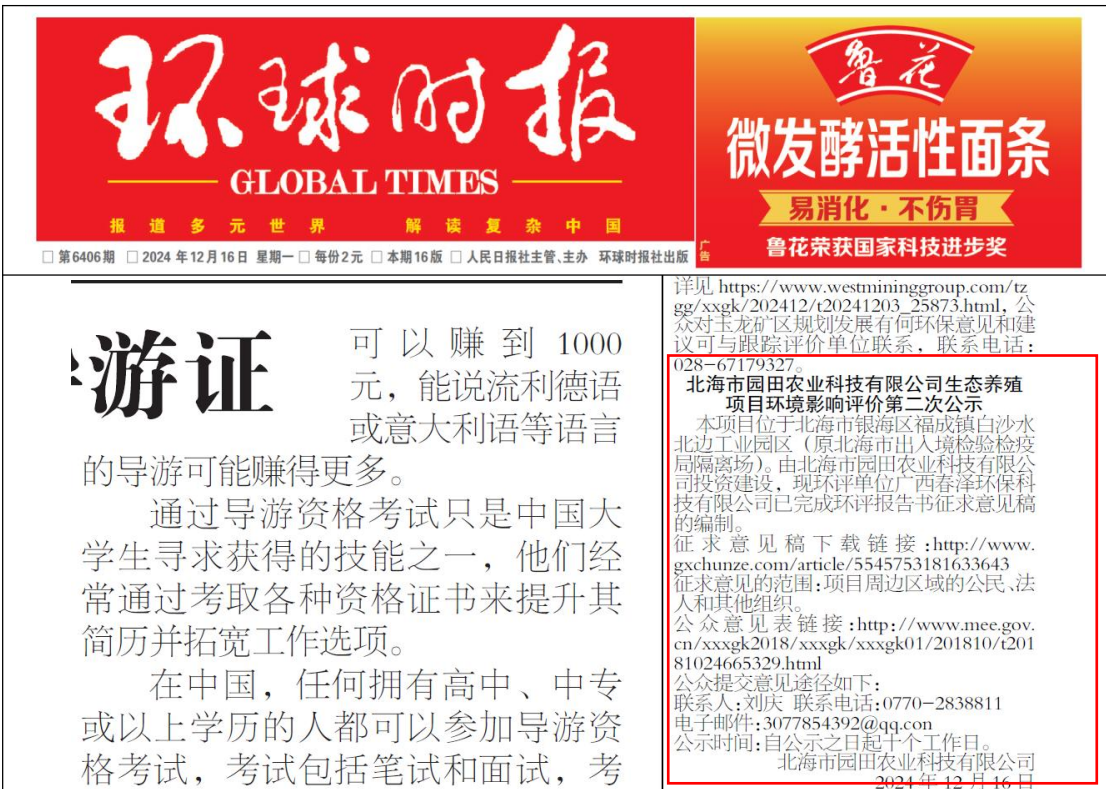
图 3.2-3 项目第二次报纸公示照片