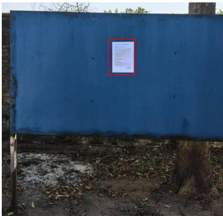
北海市园田农业科技有限公司公告栏 张贴公示

张贴区域为建设项目所在地的居民活动频繁区，张贴区域选取符合《环境影响评价公众参与办法》要求。