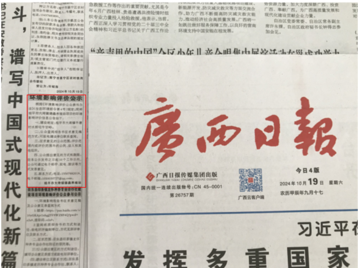
图3-3 第二次公示——报纸公示照片（2024年10月19日广西日报）