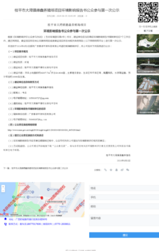
图 2-1 第一次公示——网络公示照片