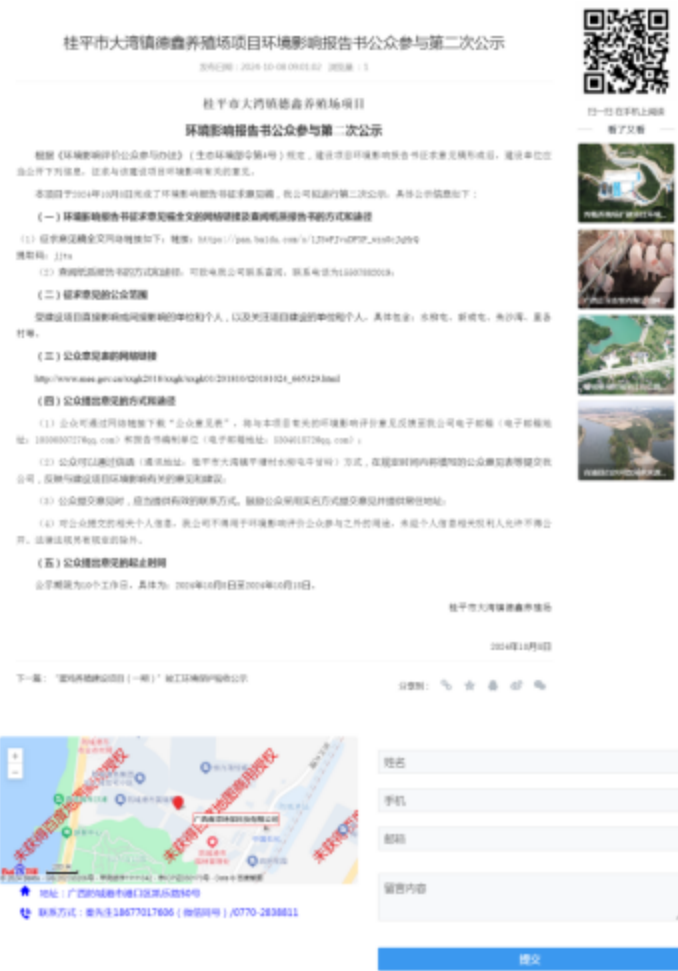
图 3-1 第二次公示——网络公示截图