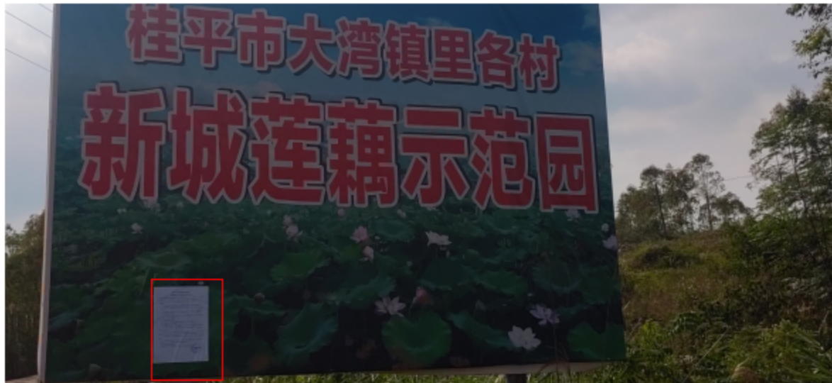
图3-5 第二次公示——新成屯公示照片（2024年10月17日）