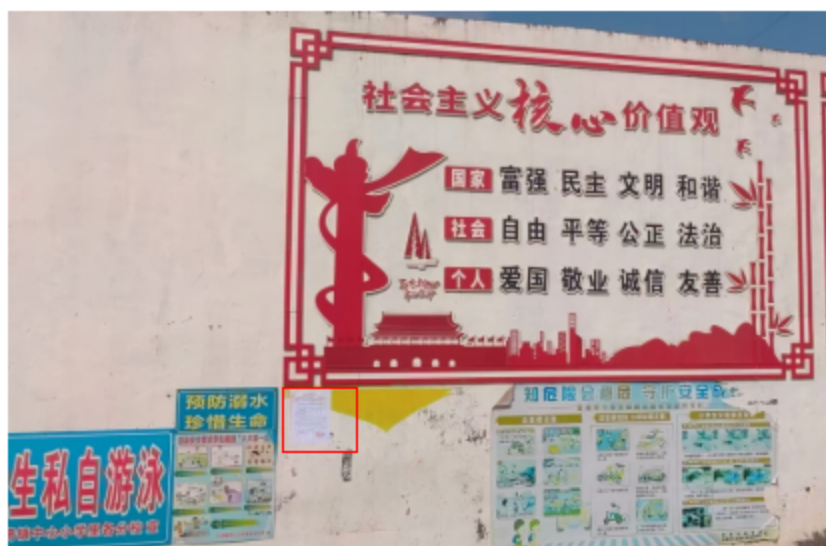
图3-7 第二次公示——里各村公示照片（2024年10月17日）