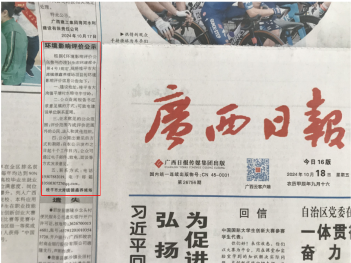
图3-2 第二次公示——报纸公示照片（2024年10月18日广西日报）