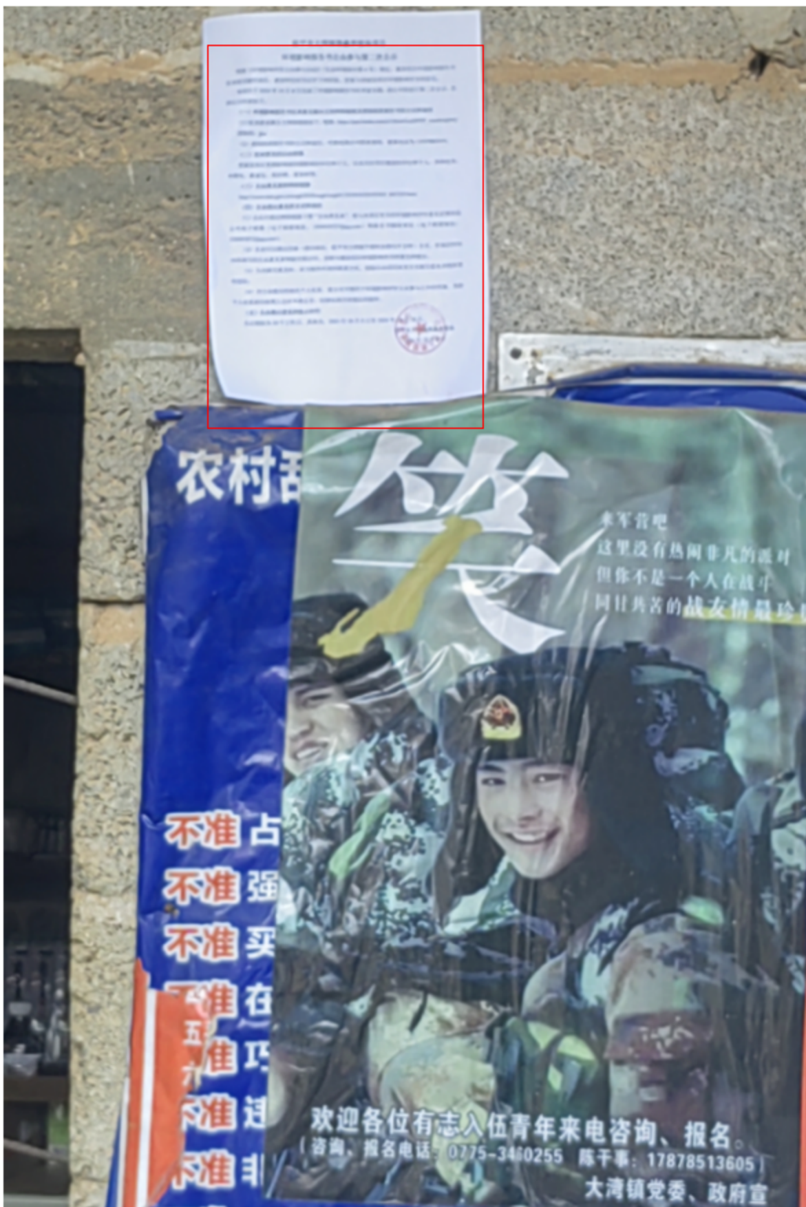
图3-6 第二次公示——朱沙湾公示照片（2024年10月17日）