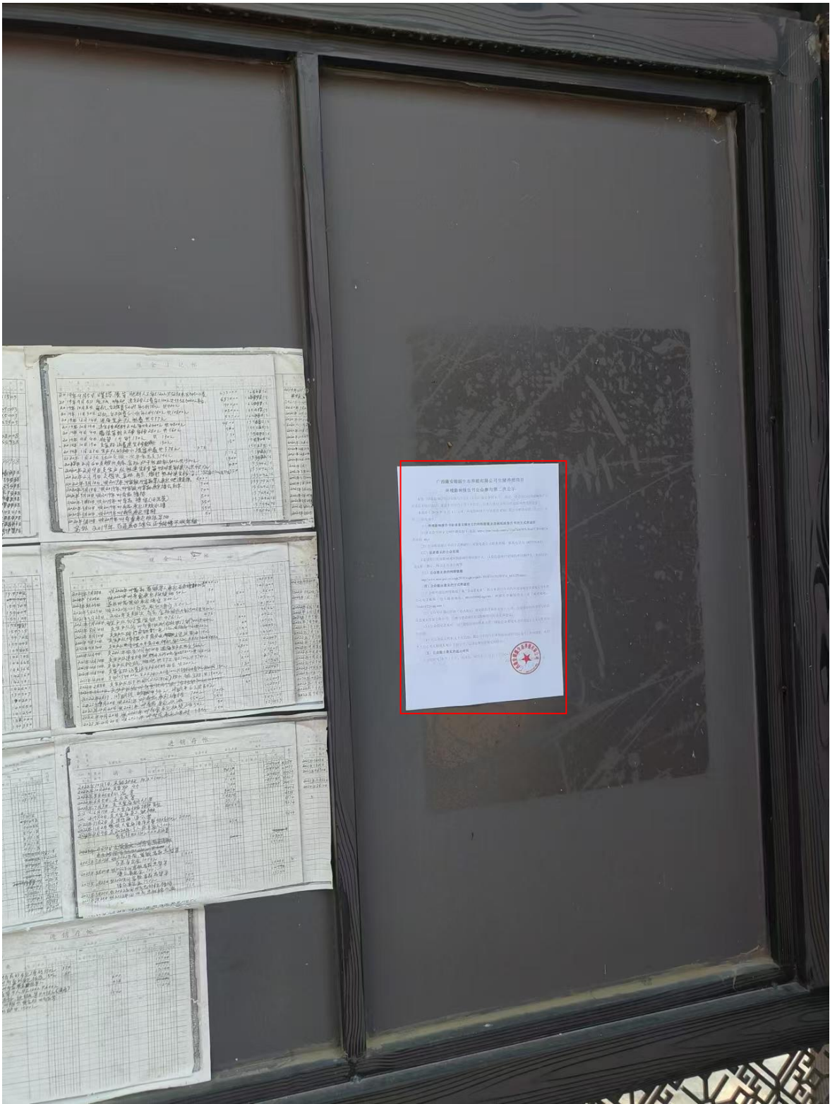
图 3-5 第二次公示——独山公示照片（2024 年 11 月 5 日）