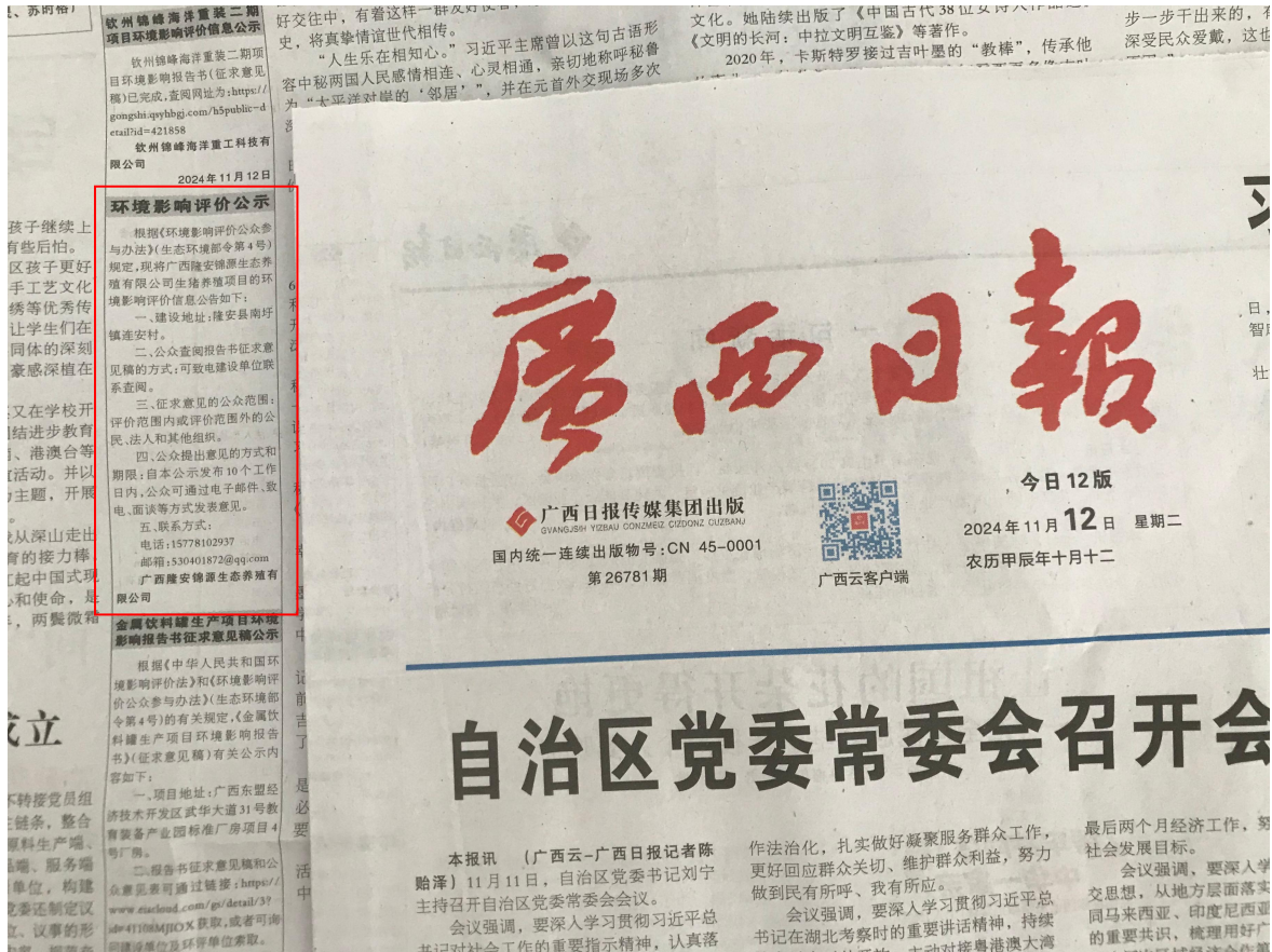
图 3-2 第二次公示——报纸公示照片（2024 年 11 月 12 日广西日报）

本项目的环境影响报告书征求意见稿形成后,我单位于2024年11月12日和2024年11月13日在《广西日报》发布了第二次公示,广西日报是广西的主流纸媒,符合《环境影响评价公众参与办法》(生态环境部令第4号)的要求,报纸公示的照片见图3-2和图3-3。