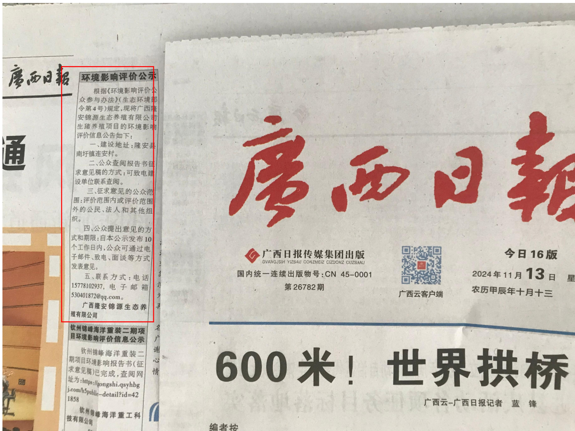
图 3-3 第二次公示——报纸公示照片（2024 年 11 月 13 日广西日报）