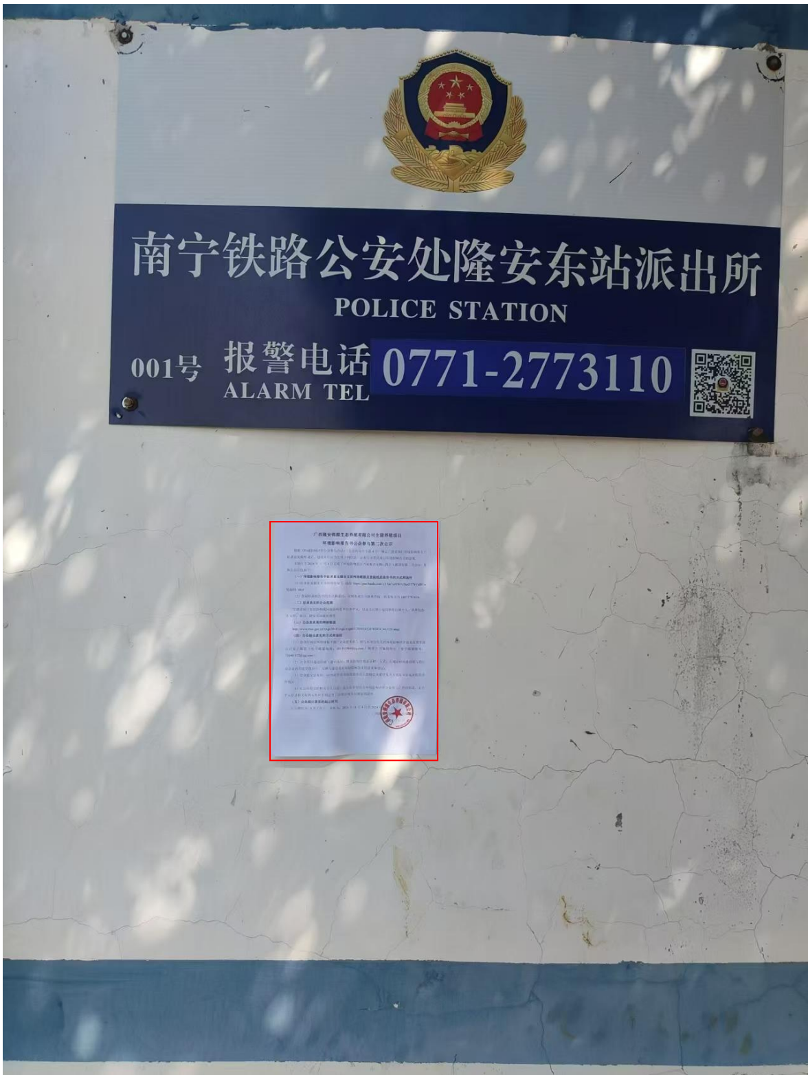
图 3-6 第二次公示——隆安站派出所公示照片（2024 年 11 月 5 日）