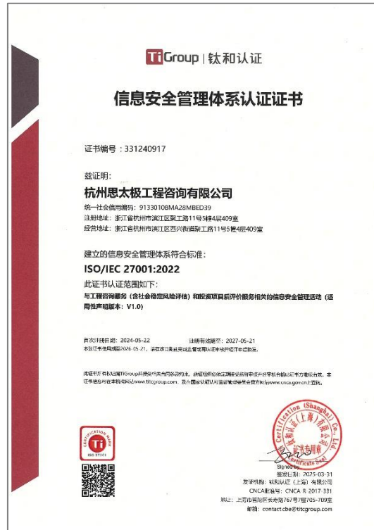
ISO/IEC 27001:2022 信息安全管理体认证证书