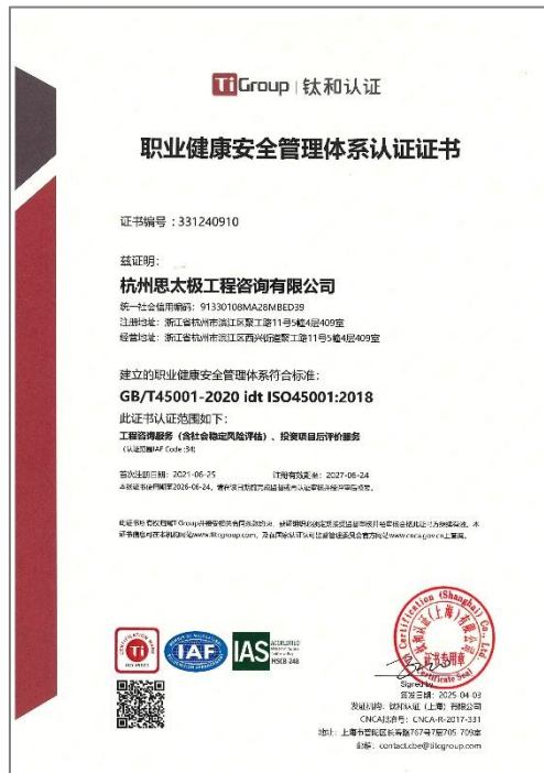
GB/T45001-2020 idt ISO45001:2016 职业健康安全管理体系认证证书

公司严格遵守相关法规，建立完善的安全生产管理体系，树立“安全第一，预防为主，综合治理”的理念。公司建立有完善的安全生产、环境管理、职业病防护及事故调查等合规制度体系，已取得了职业健康安全管理体系认证证书。