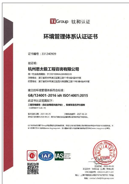
GB/T24001-2016 idt ISO14001:2015 环境管理体系认证证书