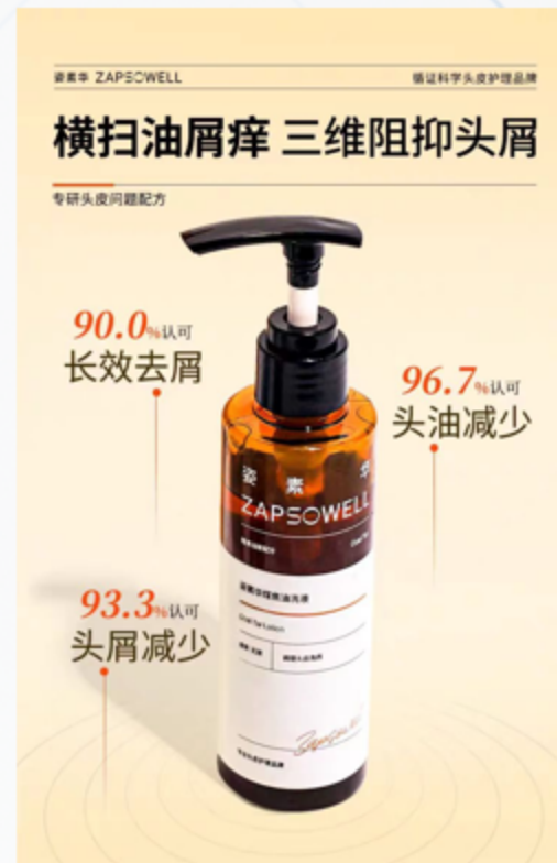
医生自有产品示例