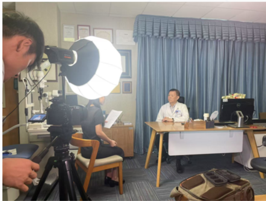
▲ 签约医生正在录制专业科普视频